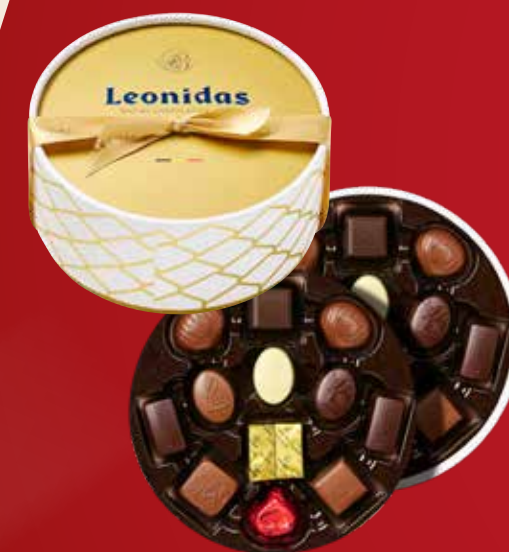
Coffret rond double

Notre coffret cadeau exclusif de 2 couches de pur bonheur et combine des classiques exquis : des pralinés, ganaches et caramels aux saveurs innovantes.