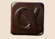
ALEXANDRE Crème de caramel aux morceaux d'écorces d'orange légèrement confites