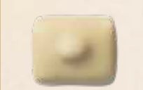
MANON CAFÉ BLANC Crème au beurre au café, praliné et noisette entière