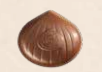
MARRON CAFÉ LAIT Praliné saveur café