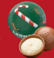
Boule Noël vanille lait