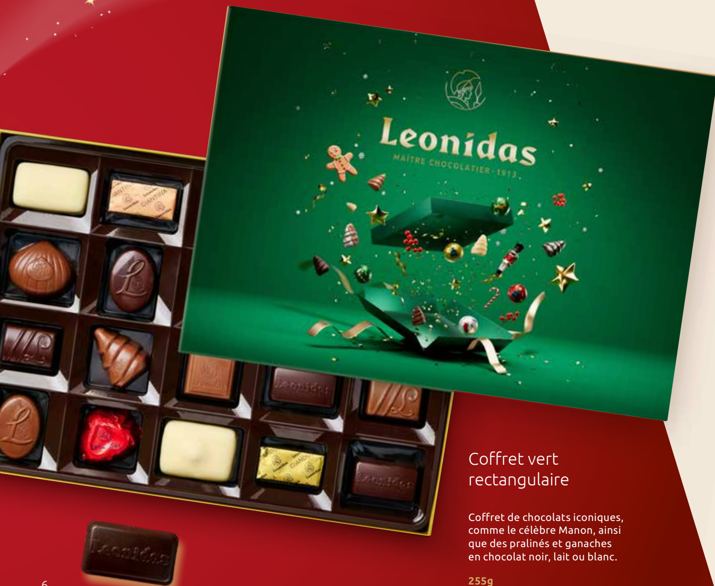
Coffret vert rectangulaire

Coffret de chocolats iconiques, comme le célèbre Manon, ainsi que des pralinés et ganaches en chocolat noir, lait ou blanc.