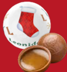
Boule Noël caramel salé lait