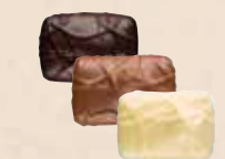
NOISETTE MASQUÉE Praliné avec une noisette entière