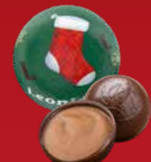
Boule Noël praliné noir