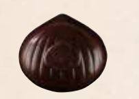
MARRON NOISETTE NOIR Praliné saveur café aux noisettes caramélisées