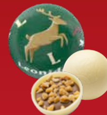
Boule Noël praliné noisettes blanc