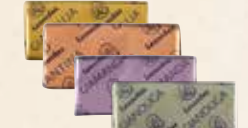
GIA Praliné, praliné aux brisures de feuilletine, praliné aux éclats d'amande, praliné aux brisures de nougat