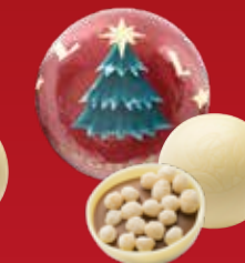
Boule Noël praliné riz soufflé blanc