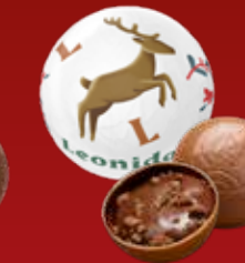
Boule Noël brownie lait