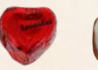
FOREVER ROUGE Chocolat au lait, praliné