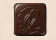
BRETAGNE Crème de caramel au sel de Guérande