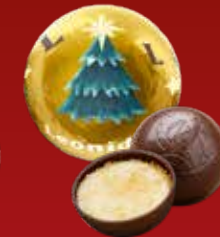
Boule Noël crème brûlée noir