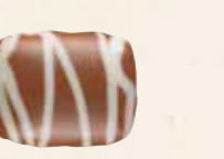
MOSAÏQUE FEUILLETINE Praliné croquant aux brisures de feuilletine