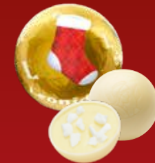
Boule Noël citron meringue blanc