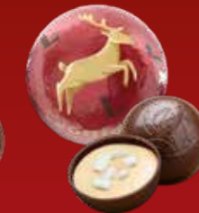
Boule Noël Mont-Blanc Marron noir