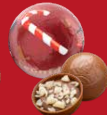
Boule Noël praliné pétillant lait