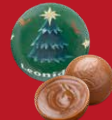
Boule Noël pâte de noisettes lait