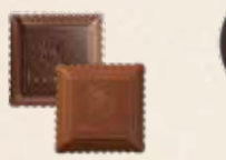
CARRÉ CROQUANT Praliné au riz soufflé