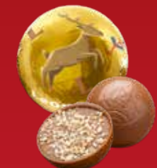
Boule Noël praliné biscuit lait