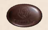
SÈTE Chocolat noir, caramel à la fleur de sel rose parfumé de touches de violettes