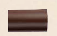
BÛCHE PISTACHE MASSEPAIN Chocolat noir, pâte d'amandes saveur pistache