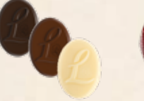
LOUISE Praliné saveur caramel, Praliné saveur caramel aux noisettes caramélisées