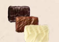
CASALEO Praliné au riz soufflé