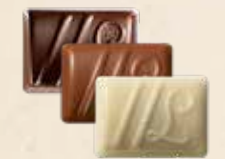
DUETTO Ganache au chocolat noir à la fraise et vinaigre balsamique ou au chocolat au lait, crème de nougat et graines de sésame ou au chocolat noir yuzu et saveur fruit du dragon

Ces chocolats ne représentent qu'une partie de notre offre.