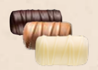
BÛCHE PRALINÉ Praliné tendre