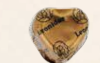
CAFÉ LAIT Chocolat au lait, crème confiseur au café