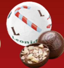
Boule Noël praliné pétillant noir