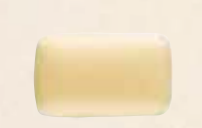
MANON BLANC Crème au beurre au café et praliné