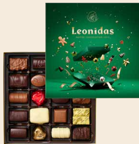
Coffret vert carré

Coffret de chocolats iconiques, comme le célèbre Manon, ainsi que des pralinés et ganaches en chocolat noir, lait ou blanc.