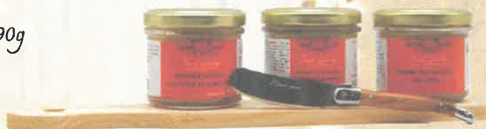
Planche à découper en bois petit modèle 30x6.5x1 Terrine de porc cul noir du Limousin verrine 90g Terrine du Limousin aux éclats de pommes au cidre verrine 90g Terrine du Limousin aux cèpes verrine 90g Couteau tartineur imitation bois 15.5x1.5cm